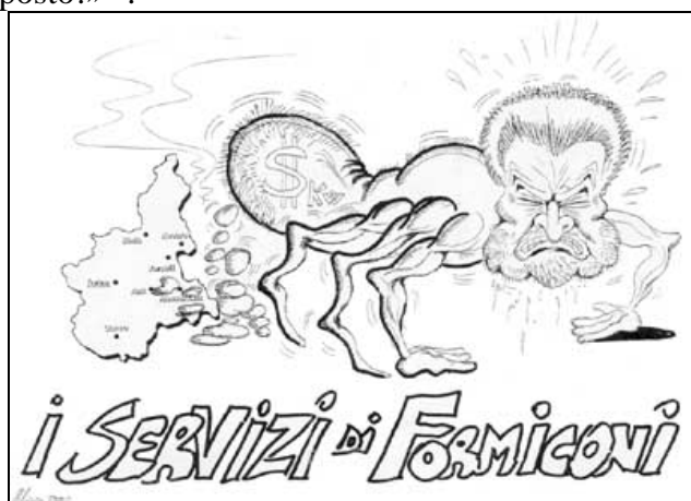
Fig. 2: Uno dei cartelli esposti alla «Marcia per la salute» del 18 maggio 2002

Nonostante i vari incontri avuti con i rappresentanti della Regione Lombardia, non si riuscirà mai a capire perchè la delibera è ferma e che cosa sta avvenendo. Parlamentari e politici vari avevano assicurato che sarebbero state presentate interpellanze in merito; ma mai la questione smaltitore è arrivata al dibattito nelle sedi politiche. A Roma era stato garantito che lo smaltitore avrebbe avuto l'onore di una valutazione di impatto ambientale collegata con gli altri ventilati insediamenti industriali: mai visto nulla! Viene il sospetto che si lasciasse trascorrere un po' di tempo per far sbollire gli animi, calare la tensione, diminuire l'attenzione e poi, ecco che... zac... ce l'hai in quel posto!» 21 .